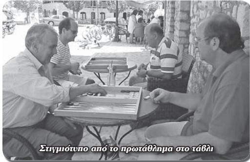
Σιγμούντο από το πρωτάθλημα στο τάβλι

Έτσι και τον Αύγουστο που πέρασε η όμορφη και ανα-