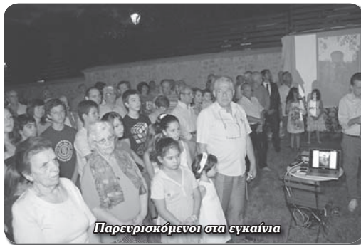
Παρευρισκόμενοι στα εγκαίνια