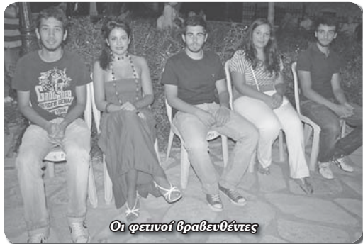
Οι φετινοί βραβευθέντες