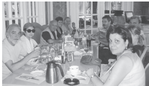
Τρώγοντας, πίνοντας και διασκεδάζοντας με την παρέα μου με μουσική τζαζ στο Luxor του Λας Βέγκας.

νήσου δίπλα στον Ειρηνικό ωκεανό και στον ομώνυμο κόλπο. Πρώτος μας σταθμός το δημοτικό κέντρο Σίβικ Σέντερ που περιλαμβάνει το Δημαρχείο, την δημοτική βιβλιοθήκη και την όπερα. Μπήκαμε στο γραφικό τραμ για τις Δίδυμες κορυφές από όπου